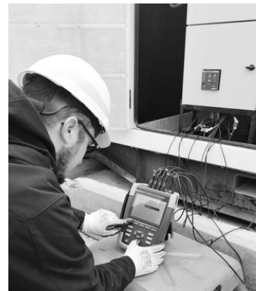
Operación de instalaciones eléctricas