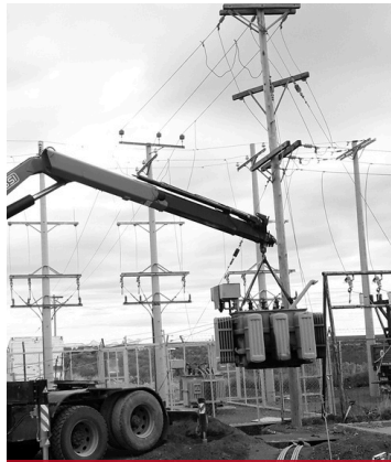
Montaje y desmontaje de subestaciones eléctricas transformadoras (SET)