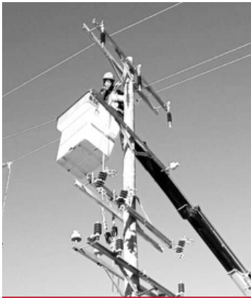
Montaje y desmontaje de líneas eléctricas (BT y MT)